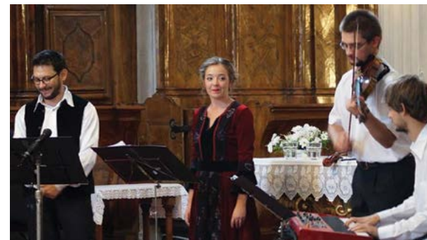
Az együttes fellépett már számos helyen, a piarista templomtól a zsinagógáig

Nincs egészen tegnap – erdélyi és máramarosi zsidó népköltés